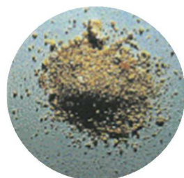
衝撃波治療によって砂状になった腎臓結石*

*(注) 破碎後の結石の状態は、結石の種類、部位、患者様の体質によって違ってきます。