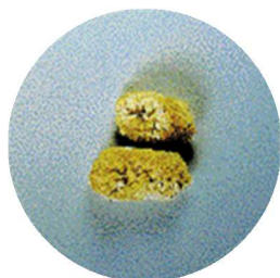
手術によって取り出された腎臓結石